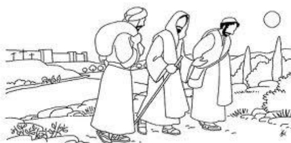
Les deux disciples marchent avec Jésus sur le chemin d'Emmaüs

Les rencontres Emmaüs du Levain, ce sont 6 soirées par an. 6 soirées d'approfondissement spirituel, avec un mime, des partages en petits groupes, des chants, des témoignages. Cela commence par un repas en silence, qui fait une coupure et crée une unité dans le groupe.