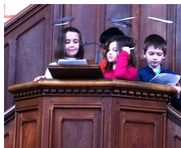
Les anges annoncent ...